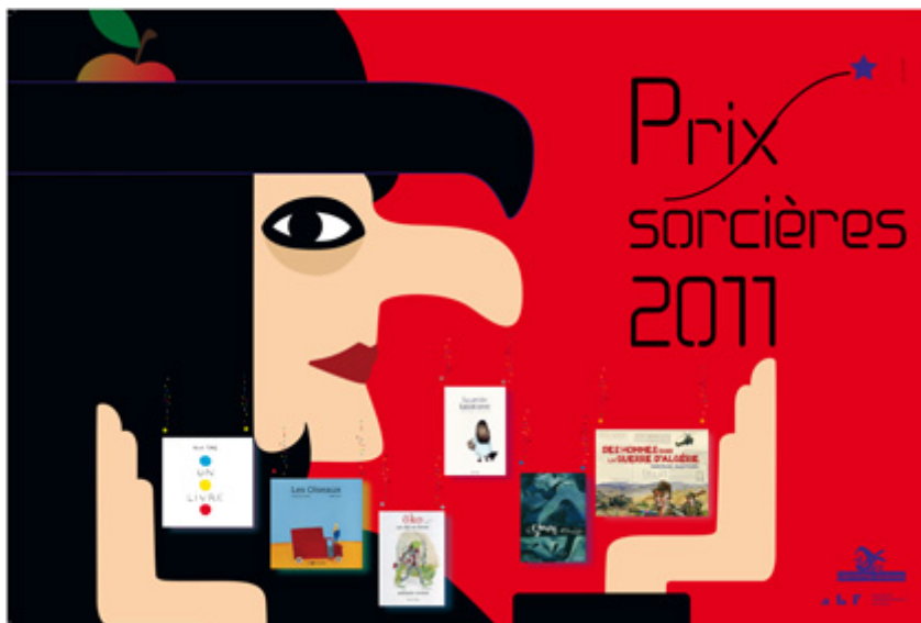
Illustration Janik Coat

Les trophées Sorcières créés par Cécile Coulette