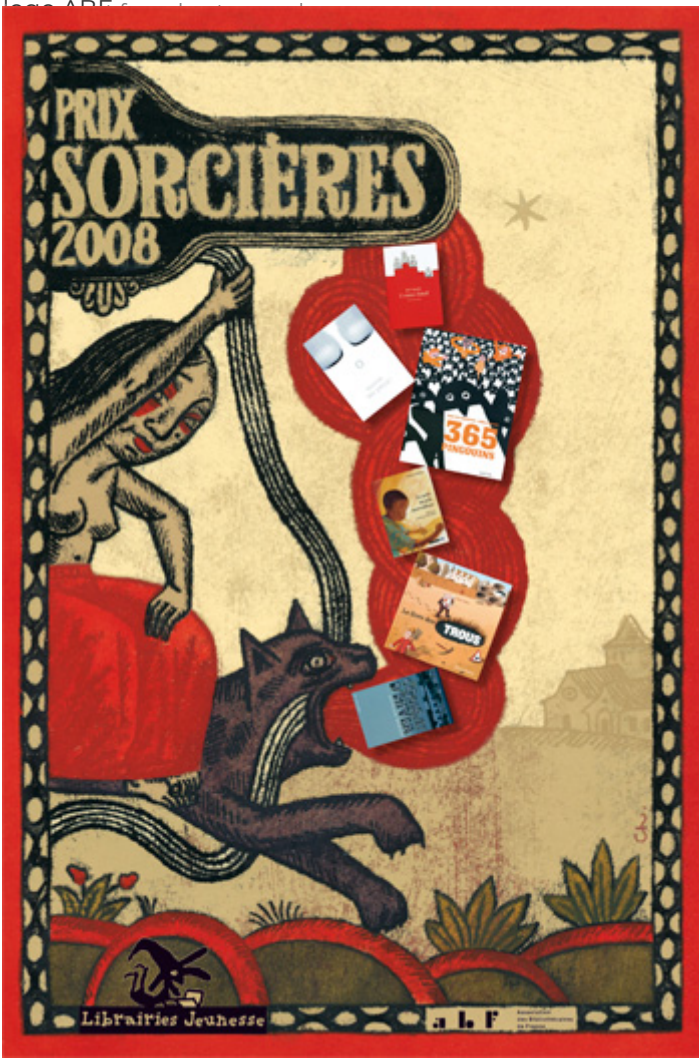
Illustration Olivier Chevalier