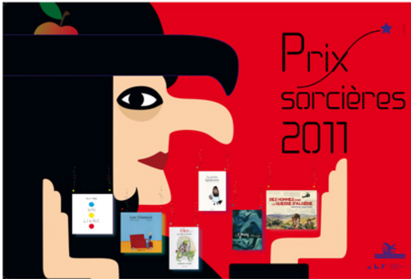
Illustration Janik Coat

Association des Bibliothécaires de France