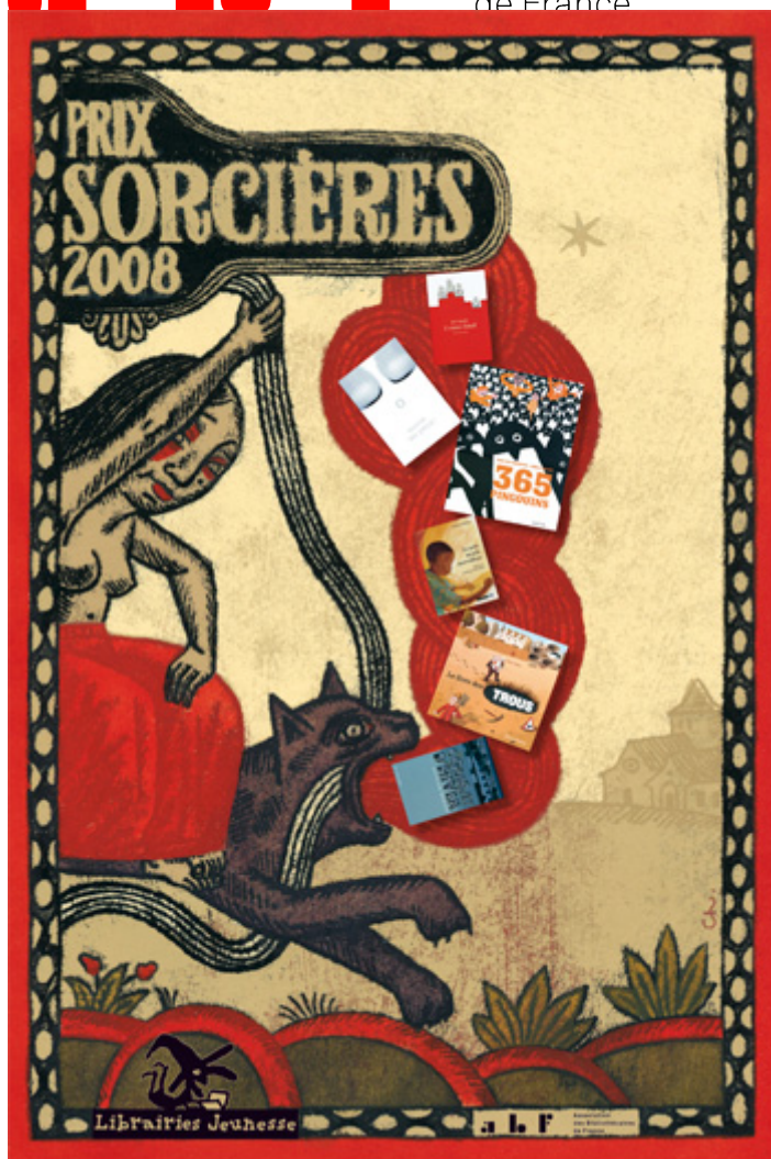
Illustration Olivier Chevalier

Association des Bibliothécaires de France