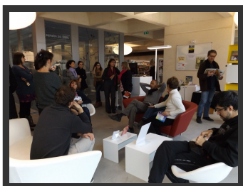
la visite de la médiathèque Montaigne de Frontignan suite à l'assemblée