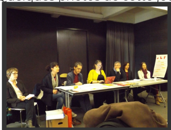
l'ancien bureau et conseil d'administration présentant le rapport moral