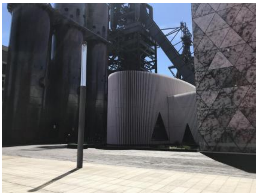
Entrée du Luxembourg Learning Centre à l'ombre des hauts fourneaux

Là où autrefois, les hauts fourneaux crachaient leurs nuages de fumées, c'est tout un territoire qui se réinvente depuis 2002. Le Luxembourg s'est résolument tourné vers le 21ème siècle, passant d'un site de production d'acier, à un site de recherche sur le territoire d'Esch-sur-Alzette, situé à 20 km au sud de Luxembourg.