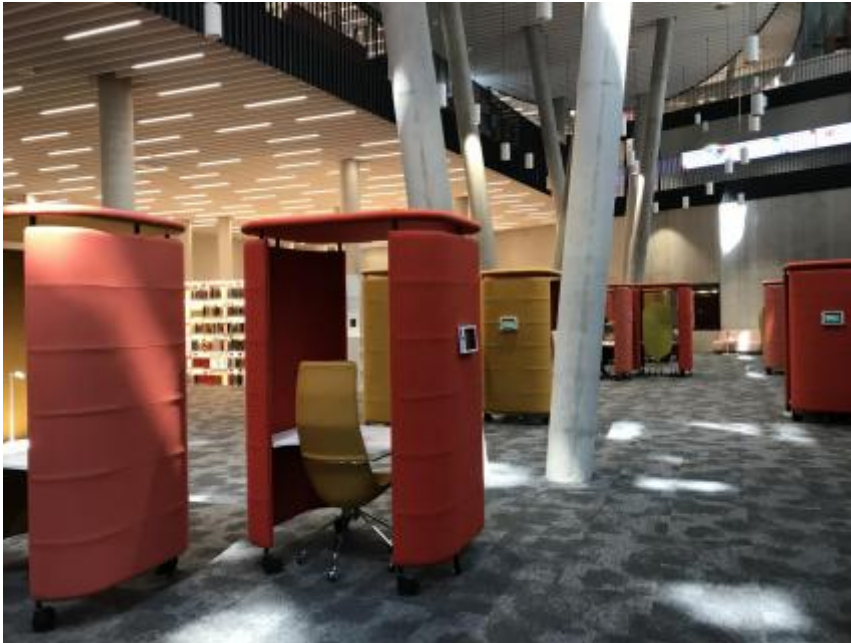
Mobilier réservable via une tablette intégrée.

Les infrastructures mises à disposition offrent une grande qualité de travail : individuel, collaboratif, en silence, travail multimédia ou salles de conférence. C'est à la carte ! Pour les collections documentaires disponibles : livres, ebooks, journaux papiers et électroniques, presse internationale, toutes ces ressources constituent une vaste offre interdisciplinaire. Le référentiel en ligne ORBilu[1] complète cette offre à travers la gestion et la publication des résultats scientifiques de l'Université.